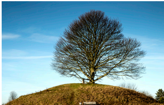
Kong Svends Høj er højdepunkt i Smørumnedre med en flot udsigt udover landskabet.

Midt i bebyggelsen ved Kong Svends Park og ligger en markant gravhøj fra bronzealderen, ca. 1.500 f. Kr. Gravhøjen er brugt til begravelse af områdets stormænd igennem en lang periode, idet man har brugt højen til mange efterfølgende begravelser.